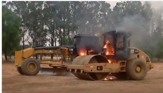
LAS DOS MÁQUINAS QUEMADAS TRABAJABAN EN UN PROYECTO DE PAVIMENTACIÓN DEL MOP.

Al lugar llegó personal del Control Orden Público (COP) y el Grupo de Operaciones Policiales Especiales (Gope) de Carabineros, quienes aseguraron la zona para que se pudieran realizar diligencias investigativas por parte de la Sección Investigativa OS-9 y el Laboratorio