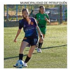
EL TORNEO SE REANUDARÁ EL VIERNES.

Ahí tendrán acceso al formulario de participación y a toda la información necesaria para inscribirse. ☞