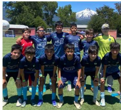
UN PRIMER, TERCER Y QUINTO LUGARES OBTUVIERON LOS REPRESENTANTES DEL CD O'HIGGINS DE VILLARRICA.

3 series fueron las que tuvieron destacadas participaciones en Pucón, por el quehacer formativo de la comuna de Villarrica.