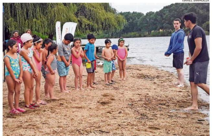
TRES CLASES POR SEMANA INCLUYE EL TALLER DE NATACIÓN DE LA MUNICIPALIDAD DE IMPERIAL.

Quienes deseen participar en el taller deben cumplir con el requisito de edad e inscribirse en las oficinas municipales. Para informaciones están habilitadas las redes sociales del municipio. ☞