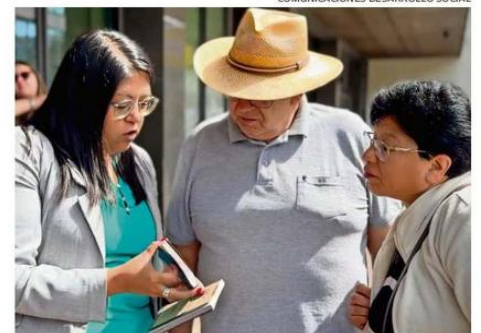
ESTA GUÍA DE BOLSILLO EN FORMATO FÍSICO SE PUEDE RETIRAR EN LAS DISTINTAS SEREMÍAS DEL MIDESOF Y SE ENCUENTRA EN SU VERSIÓN DIGITAL EN EL SITIO WEB DE RED DE PROTECCIÓN SOCIAL (WWW.REDDPROTECCION.CL).

garantías. Esto es un tremendo esfuerzo que estamos haciendo para llegar a la ciudadanía, pero además demuestra y confirma el compromiso que tiene el Gobierno del Presidente, Gabriel Boric, con mejorar la calidad de vida de las familias de nuestro país y región, porque lo que aquí van a encontrar es una tremenda guía de bolsillo con todos los beneficios, los bonos y derechos a los que pueden acceder las familias”, concluyó la autoridad. ☎