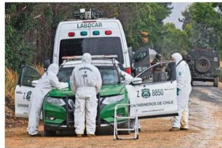
LA PATRULLA NISSAN DE LA CUARTA COMISARÍA VICTORIA FUE BALEADA.

Ahora, las diligencias de la Fiscalía estarán orientadas en establecer la dinámica exacta de los hechos y verificar si, eventualmente, el incendio de pastizales fue algún tipo de