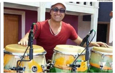
LA CLASE SERÁ HOY DESDE LAS 11 HASTA LAS 13 HORAS.

grupo tuvo un intenso calendario de conciertos en Temuco, Concepción y Valdivia presentando oficialmente su primer ep, acompañando a Abducción, Yakuza 3000 y Solario en shows que tuvieron lugar en Microsala (Temuco), Sala Bandera Negra (Concepción) y bar El Barril (Valdivia). La banda también fue parte del line up oficial del Festival Temuco Suena, que se realizó a fines de diciembre, donde compartió escenario con agrupaciones como Asia Menor, Abducción y Chini.png.