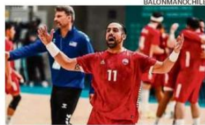
A LAS 14:00 HORAS PARTE LA ACCIÓN.

● La selección chilena de balonmano debutará hoy ante España en el Mundial que se juega en Noruega y Croacia. El combinado del país protagonizará en Oslo su primer duelo en esta Copa a las 14:00 horas y se verá por la señal de DirecTV. Chile lleva clasificando ocho veces consecutivas a la máxima cita del balonmano a nivel mundial. ☞