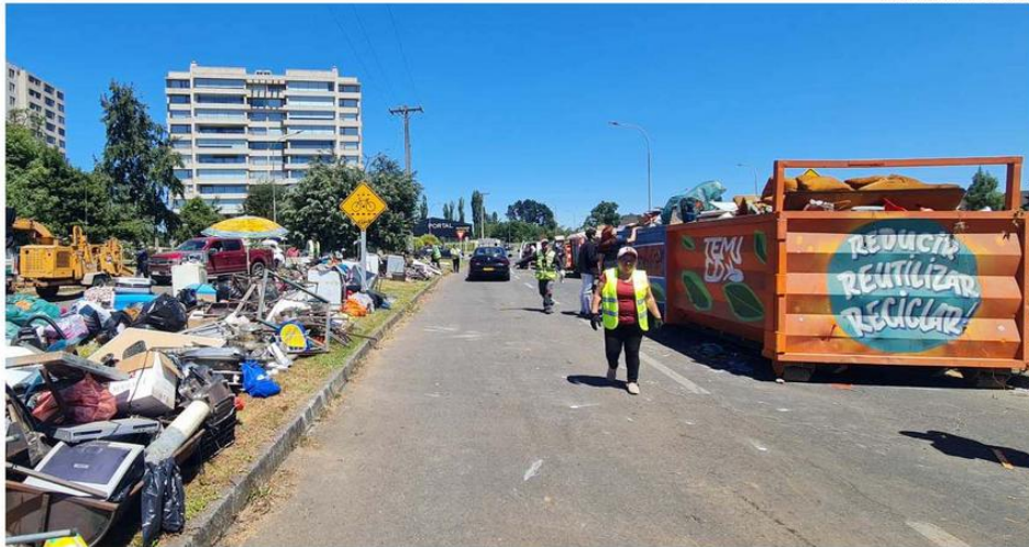
ESTA INICIATIVA CERRÓ EL AÑO 2024 CON LA REALIZACIÓN DE 37 JORNADAS EN DISTINTOS SECTORES DE LA COMUNA, LOGRANDO RETIRAR UN TOTAL DE 496 TONELADAS DE RESIDUOS Y ARTÍCULOS EN DESUSO.

El programa también destaca por su componente de economía circular, al trabajar en conjunto con 15 recicladores de base certificados de la comuna, quienes reparan y dan una segunda vida a aquellos artículos que aún tienen potencial