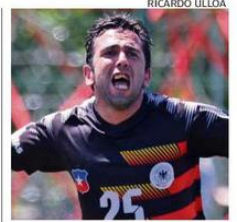
EL CERTAMEN SIEMPRE ACAPARA MUCHO INTERÉS.

por el tercer lugar. El encuentro lo ganó la Línea 9, que superó por 5-2 a la Línea 6. ❧