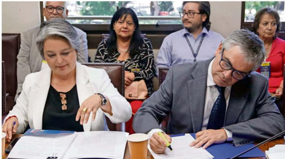
LOS MINISTROS JEANNETTE JARA Y MARIO MARCEL LLEGARON HASTA EL CONGRESO PARA DISCUTIR LA REFORMA EN LA COMISIÓN.

También la ministra dijo que estas indicaciones buscan fortalecer el ahorro individual, más un aumento de la cotización de 7%, con aporte de los empleadores, que se suma al 1,5% del Seguro de Invalidez y