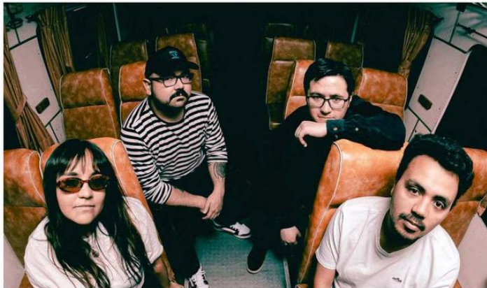
LA BANDA TAMBIÉN FUE PARTE DEL LINE UP OFICIAL DEL FESTIVAL TEMUCO SUENA, QUE SE REALIZÓ A FINES DE DICIEMBRE, DONDE COMPARTIÓ ESCENARIO CON AGRUPACIONES COMO ASIA MENOR, ABDUCCIÓN Y CHINI.PNG.

El videoclip de “Eterno Momento” ya se encuentra disponible en el canal de Youtube de Brisa de Invierno ( https://www.youtube.com/@BrisadeInvierno ) y también se puede acceder desde la siguiente dirección: https://www.youtube.com/watch?v=9S4zOEa-najs