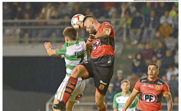
EN LA COPA CHILE 2025, DEPORTES TEMUCO SE ENCONTRARÁ CON RANGERS. AMBOS EQUIPOS TAMBIÉN SERÁN RIVALES EN EL CAMPEONATO DE PRIMERA B.

A la espera de la confirmación del arranque del certamen, el plantel de Deportes Temuco se prepara para la Noche Albiverde. La jornada se vivirá el sábado y en ella recibirá a Puerto Montt. ❧