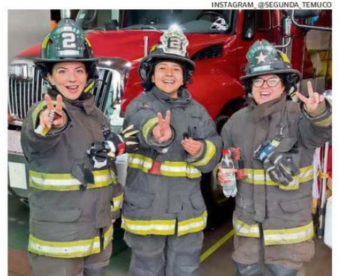
EN INSTAGRAM SE HIZO VIRAL UN VIDEO PROTAGONIZADO POR TRES BOMBERAS SEGUNDINAS, QUIENES PIDEN DONACIONES PARA SU CUARTEL UBICADO EN CALLE BULNES 0135, ENTRE BILBAO Y EL CERRO ÑIELOL.

Los videos de esta campaña se han viralizado en Internet. De hecho, un video de la Segunda Compañía, en su cuenta de Instagram (@segunda_temuco), en el que tres bomberas piden donaciones, logró más de 15 mil visitas solo en un día.