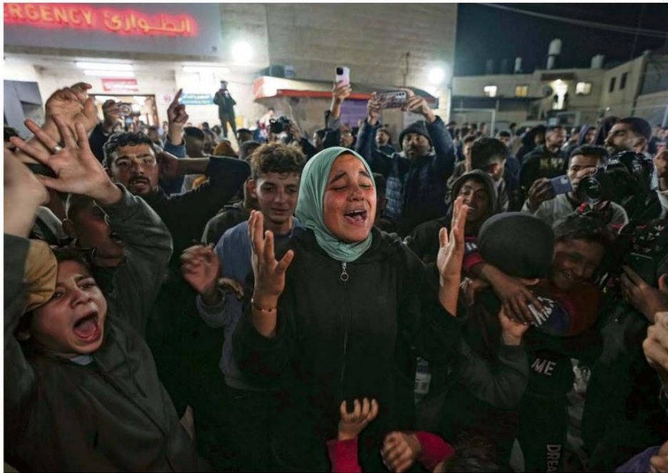
UN GRUPO DE PALESTINOS CELEBRABA AYER LAS NOTICIAS DE UN PRINCIPIO DE ALTO AL FUEGO EN GAZA EN DEIR AL-BALAH, EN EL CENTRO DE LA FRANJA.

Según dijo Abderrahmán, hasta anoche se trabajaría para "finalizar los trámites de implementación" y el acuerdo entrará en vigor el domingo 19 de enero a las 12.15 horas de Gaza, y en su primera fase se extenderá por un periodo de 42 días en