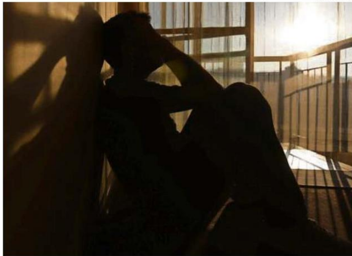
LA DEPRESIÓN ES UNA ALTERACIÓN DEL ÁNIMO QUE AFECTA TODAS LAS ÁREAS DE LA VIDA DE UNA PERSONA.

A juicio del médico, este trastorno tiene múltiples manifestaciones y no siempre se presenta de la misma manera ya que algunas personas pueden mostrar síntomas evidentes, como una actitud más lenta o la falta de interés en las actividades, sin embargo, en otros casos, los síntomas son menos visibles y el paciente puede hacer esfuerzos para ocultar su malestar. “A veces, las personas con depresión intentan disimular su sufrimiento, lo que hace más difícil que se detecte a tiempo”, señala Delarze.