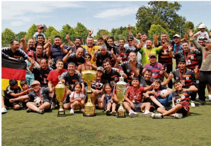
TRAS DERROTAR A LA LÍNEA 3, LOS JUGADORES DE LA LÍNEA 1 CELEBRAN CON LA COPA DE CAMPEONES.

En la ceremonia se entregaron distinciones a los dos mejo-